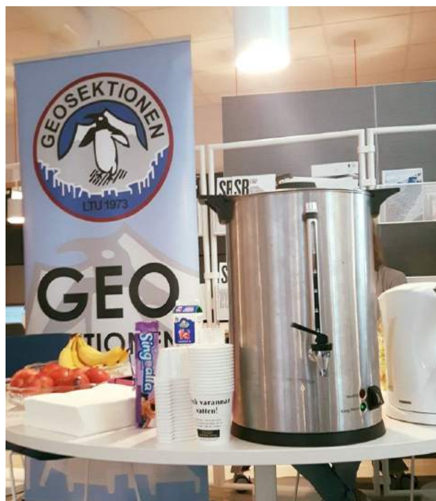
GeoFika—Förgyller studenters vardag

Styrelsen har tillsammans jobbat fram ett nytt upplägg för sektionens med en styrelse och en ledningsgrupp. Arbetsmarknadskontakten kommer framöver att sitta med i ledningsgruppen, i övrigt kommer arbetet fortskrida som vanligt.