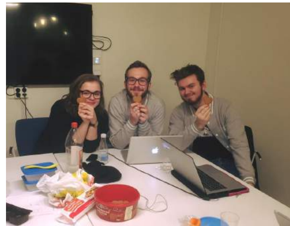
Arbetsmöte—Sammanställning av sektionsmöteshandlingar

En annan stor roll för vice under våren har varit att ansvara för lilla och stora nolleperioden samt andra event under sektionen. Under Lilla Nolle-p anordnades en pizzakväll i bunkern. Under Stora Nolleperioden anordnades en sektionsdag, en sektionsmiddag, uphykten samt hjälpa bunkern under en kväll. Under nolleperioden hoppades jag att mer skulle kunna genomföras men detta fick prioriteras bort på grund av personalbrist.