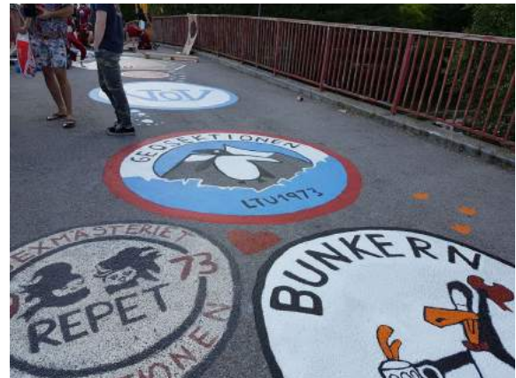
Bromålning - Nolleperioden 2017

Arbetet har även bestått av att organisering och stöttande av styrelsens dagliga och strategiska arbete. Under slutet av hösten agerade vice ordförande rekryterare och rekryterade styrelsens vakanser inför våren 2017